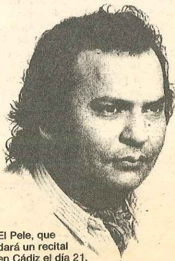
El Pele, que dará un recital en Cádiz el día 21.

El Pele y su guitarra inseparable, la de Vicente Amigo, darán un recital en Cádiz el día 21, a las 9 de la noche. Será dentro del ciclo Cante en el café , y el lugar el café El Tinte, en la calle del Tinte, número 1.— A. A. C.